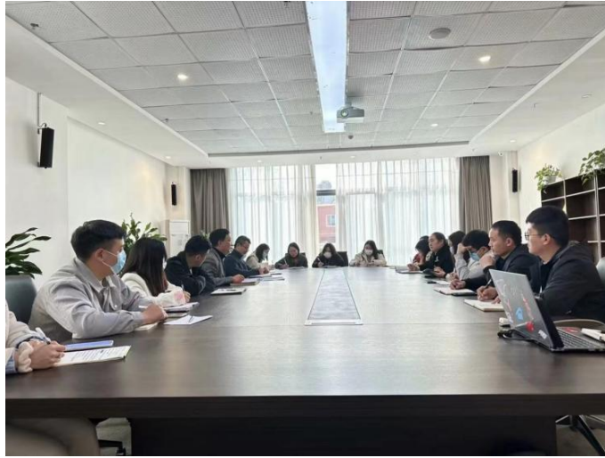
图 8 开展全院师生心理健康筛查工作部署会

开学初期，学院邀请廖彩之教授对全体教师进行以“高校教师心理健康与压力管理”为主题的全员培训，提高全体教职工的心理健康水平以及心理健康防护意识，进一步促进和谐校园的建设，培育了师生积极向上的心态，也为学院心理健康教育工作的有效开展提供了保障。为进一步加强学院心理健康教育工作，全面提高学生工作队伍心理危机干预工作水平和能力，大学生心理健康教育与指导中心于4月7日组织全院辅导员、班主任在教学楼 A210 参加心理健康教育专题培训，培训主要包括学生常见心理健康问题的识别与应对方法及辅导员、班主任的心理健康问题两部分内容，通过培训进一步提升了辅导员、班主任全面把握学生心理问题、精准应对大学生心理危机的能力水平。