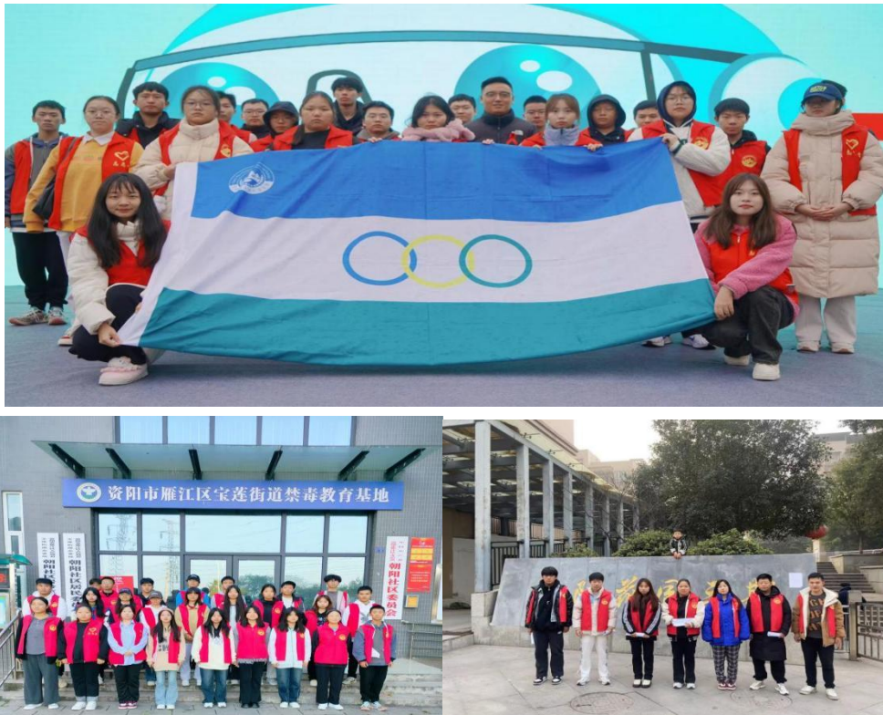
图 7 参加资阳市第三届“12.1”艾滋病日宣传活动

前往养老院、学院迎新活动、社区、联合资阳市志愿者协会举办多次活动，在过去的一年里，学院青年志愿者协会新增注册志愿者人数 4347 人，展现了学院师生对志愿服务的热情与支持。截至目前，学院注册志愿者人数已达万人之上，学院志愿者服务时长共计 10434.3 小时。这些数字充分展示了学院志愿者们的无私奉献精神，也为学院赢得了良好的社会口碑。