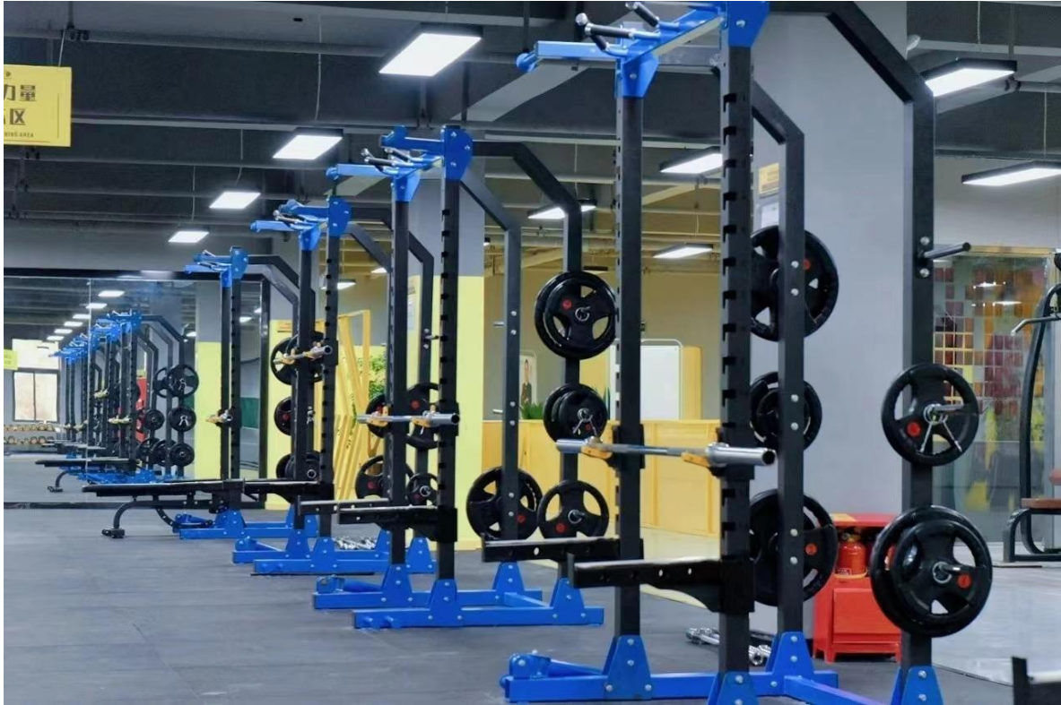
图 18 学院健身健美训练与体能训练实训室