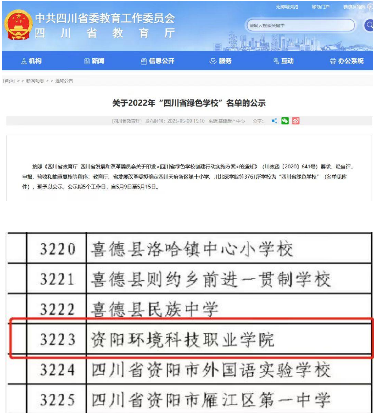
图 1 学院获得 2022 年“四川省绿色学校”荣誉称号