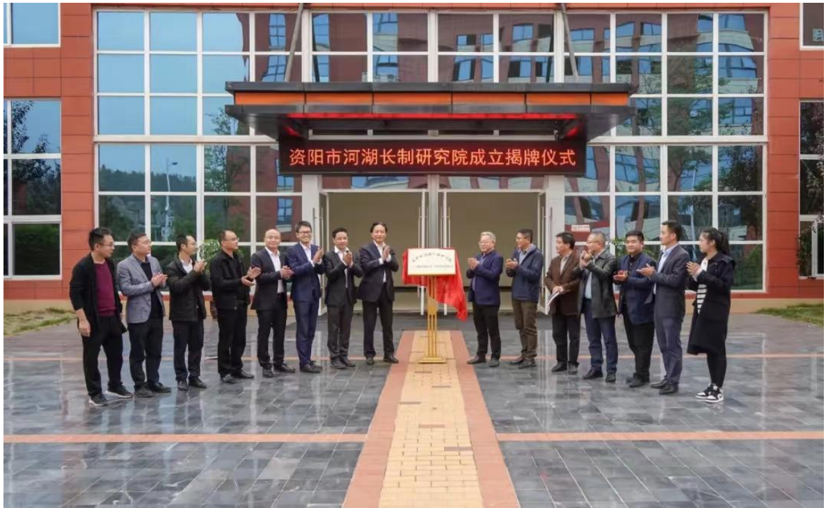
图 23 资阳市河湖长制研究院成立揭牌仪式