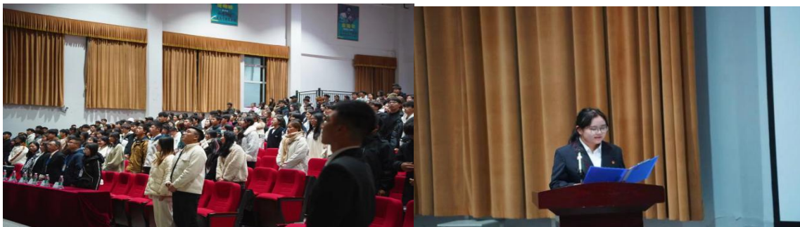
图 6 院团委开展第四期青马工程开班仪式