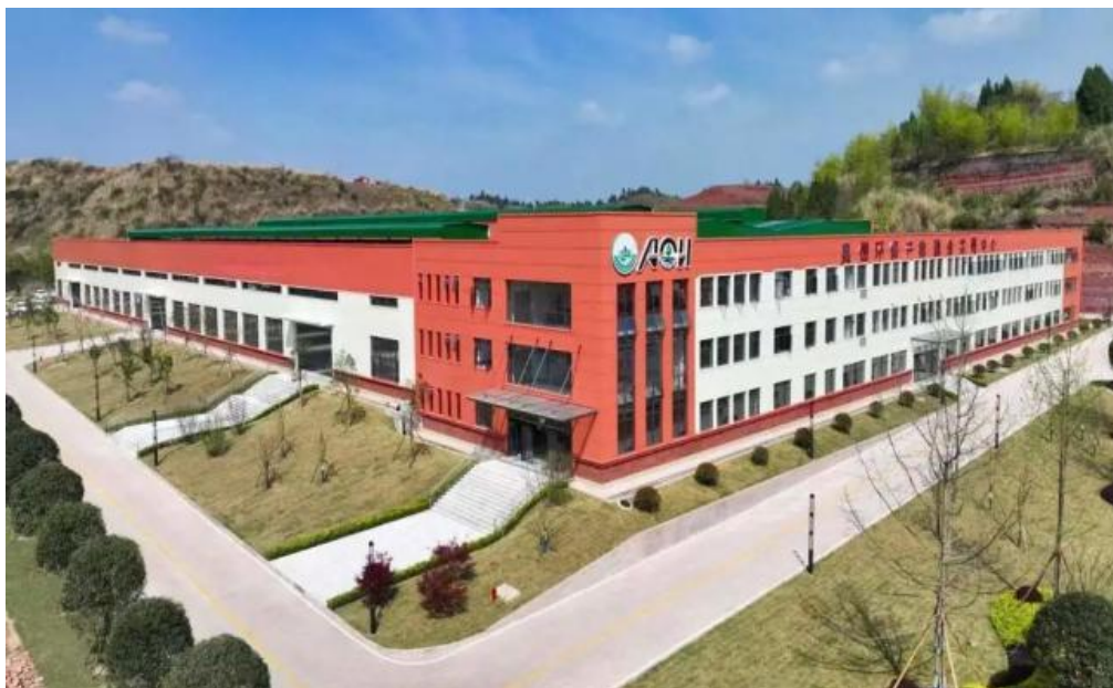
图 19 “校中厂”——奥恒环保产教融合实践中心

学院申报的《校企共建生产性实训基地的探索与实践——以资阳环境科技职业学院奥恒环保实训基地为例》获批四川省2022-2024年职业教育人才培养和教育教学改革研究重点项目。2023年7月，《资阳环境科技职业学院与四川奥恒环保科技有限公司环境工程技术现场工程师联合培养项目》获批四川省第一批现场工程师专项培养计划项目，预计每年向该企业输送环保运维工程师、采样工程师、检测工程师约30人，助力企业人才需求，加强科技转化，社会化服务成果显著。