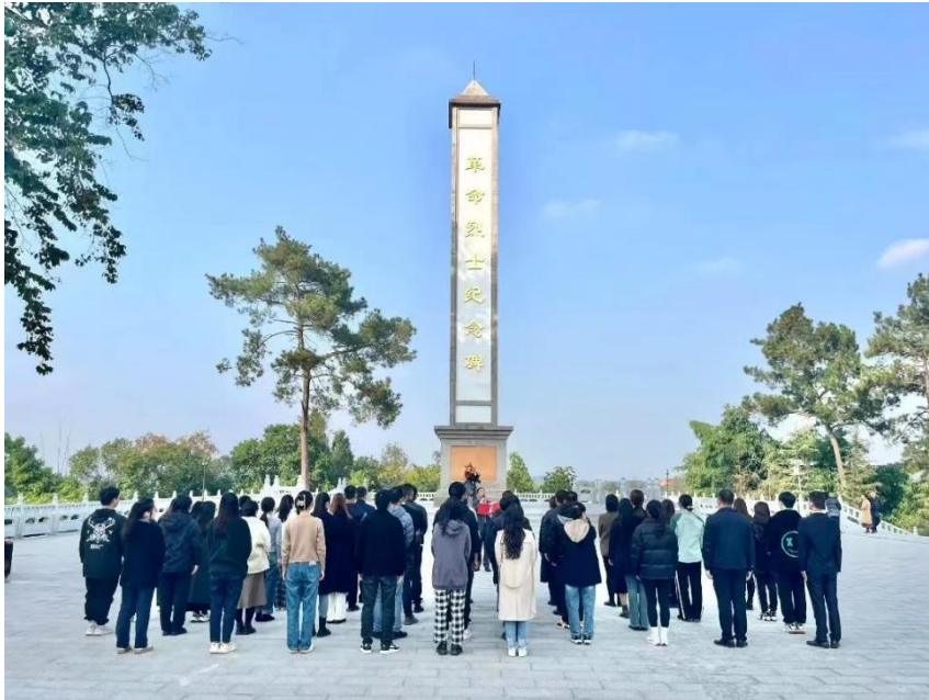
图 27 “资阳市革命烈士纪念馆”学习追寻红色踪迹

发挥职业教育技能人才培养功能，开展行业岗位培训、对外师资培训和技能鉴定等各类短期培训服务。近几年来学院充分发挥专业、师资、实习实训条件，为行业企业、政府部门、社会人员和在校学生提供优质的培训服务。