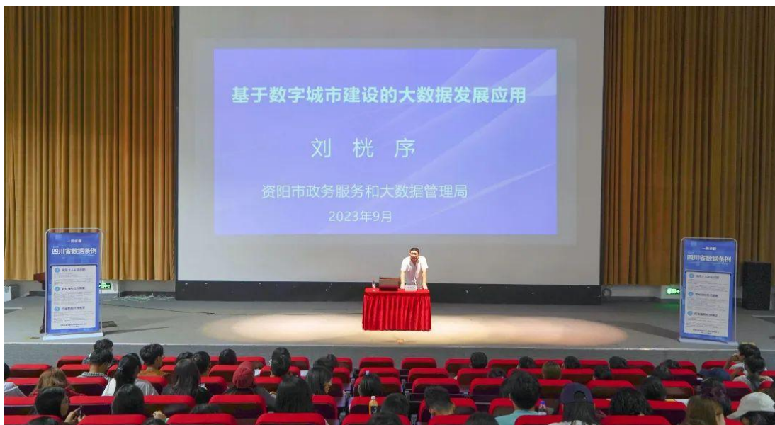
图 3 “基于数字城市建设的大数据发展应用暨四川大数据条例宣讲活动”专题讲座

知行合一”的校风，高度重视学生思想发展，立足培养党和社会主义接班人，积极开展各种思想政治教育活动达 20 余次，发展新团员 240 余名，培养入党积极分子 300 余名。青年大学学习每期参加达 10000 人以上，参学率均在 100%以上，名列全川前列。持续开展德育讲座。2022-2023 学年，学院各系部以及职能部门邀请校内外专家学者共组织开展了“一月一讲堂”《法制教育安全》《新时代大学生网络素养培育及提升漫谈》等主题的德育讲座 20 余场，参与学生达到 9000 人次。通过开展各类主题的德育讲座，从而更好地做到了关注学生成长需求，提升学院育人成效。