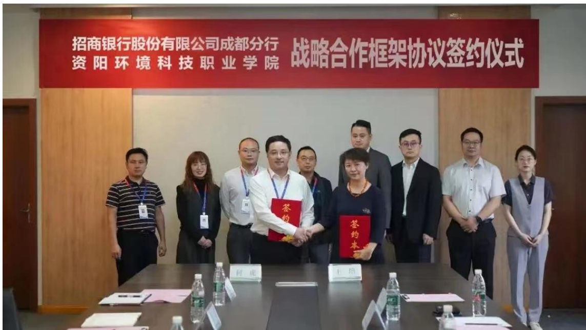
图 31 学院与招商银行股份有限公司成都分行签订校企合作协议