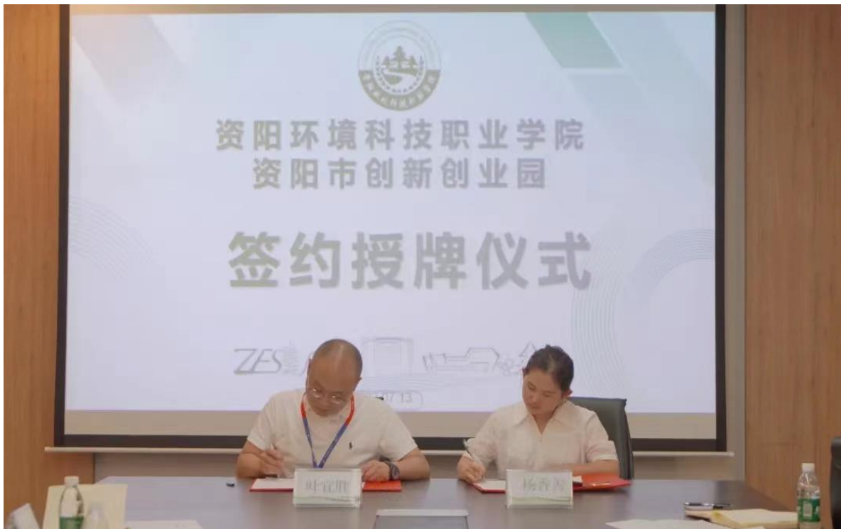
图 14 学院与资阳市创新创业园签约授牌仪式

行签约授牌仪式，以本次签约授牌为契机，双方将遵循互惠互利、合创共赢、协同发展的合作原则，在专业建设、课程开发、创业培养、社会服务等方面开展广泛深入的校企合作，通过密切衔接的新型创业人才培养模式，助力学生高质量就业创业，为地方发展提供人才保障。