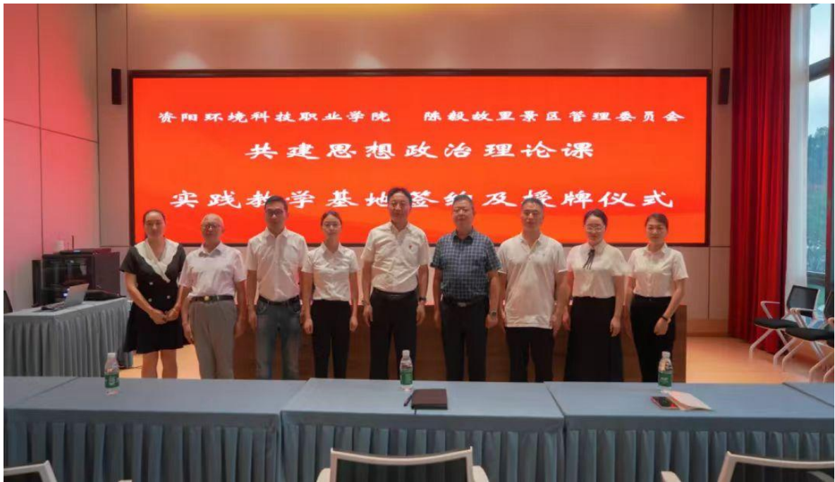
图 29 学院与陈毅故里景区管理会签约共建实践教育基地