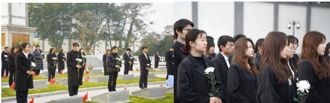
图 5 院团委带领学院师生到资阳市烈士陵园开展 12·9 活动

为深入学习贯彻习近平新时代中国特色社会主义思想 and 党的二十大精神，响应团中央关于“青年马克思主义者培养工