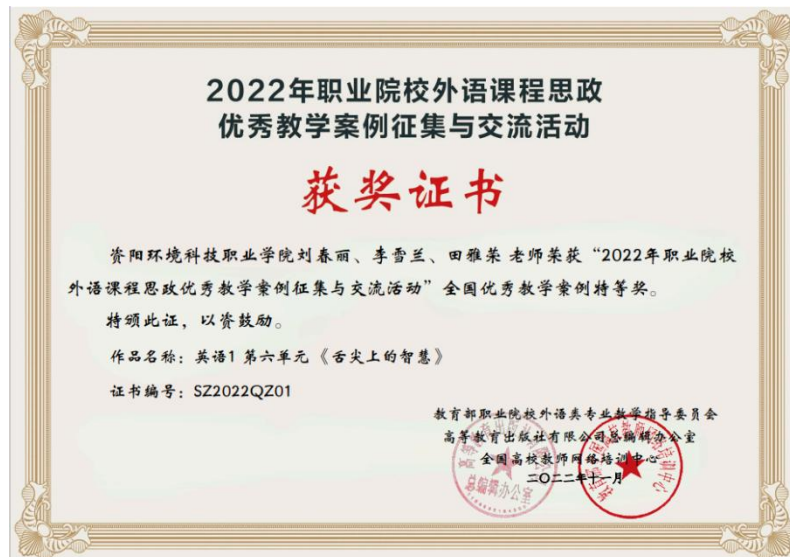
图 20 获得 2022 年职业院校外语课程思政优秀教学案例征集与交流活动 全国优秀教学案例特等奖

本次比赛获奖是英语课程贯彻落实“课程思政”的又一成果。以赛促教，以教促学，英语教师始终致力于将语言教育和思政教育融通，使能力培养与思想塑造共振，深耕英语教学课程思政的责任田，以通过巧妙设计，穿插思政教育于英语教学中，润物细无声，达到于无声处听惊雷的效果。