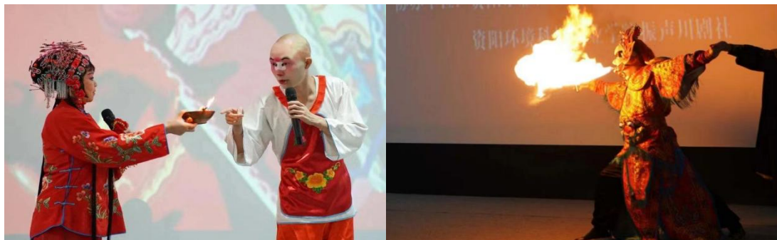
图 10 学院社团川剧社宣传展演活动