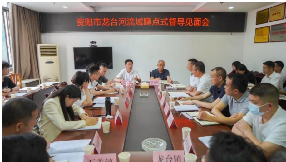
图 24 环境工程系资阳市龙台河流域蹲点式督导见面会

随着调研的深入，师生们也切实体会到了河湖生态对当地农业产业现代化发展的重要作用，河湖是全人类亟待保护的珍贵自然遗产，科学保护流域生态尤为重要。未来，环境工程系将继续为河湖长制蹲点式督导工作提供完善的调研资料，同时利用专业知识技能知识，为地方河湖保护事业贡献青春力量。