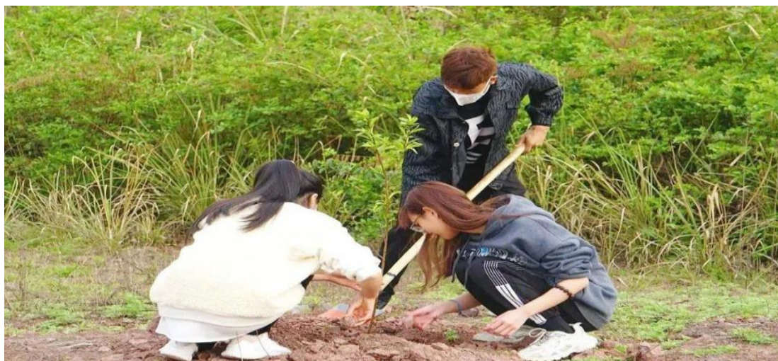
图 11 园艺社植树节活动