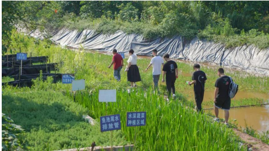
图 25 环境工程系团队进行污水排放治理情况实地调研