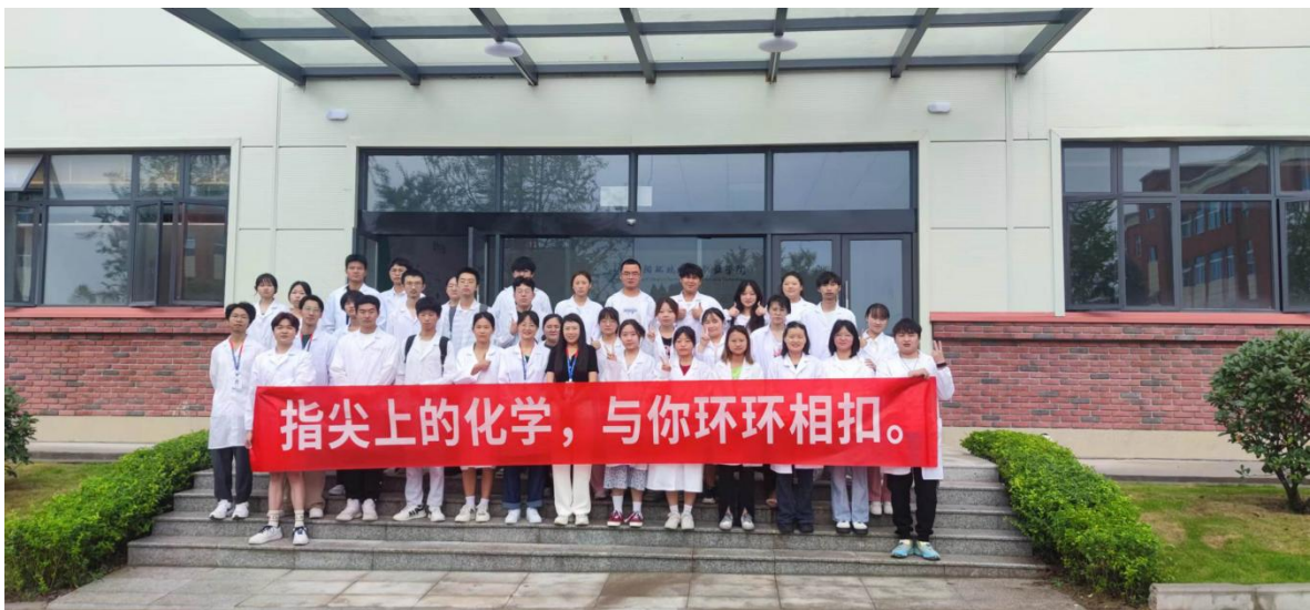
图 15 学院开展第二届化学实验技术竞赛校赛决赛选手合影