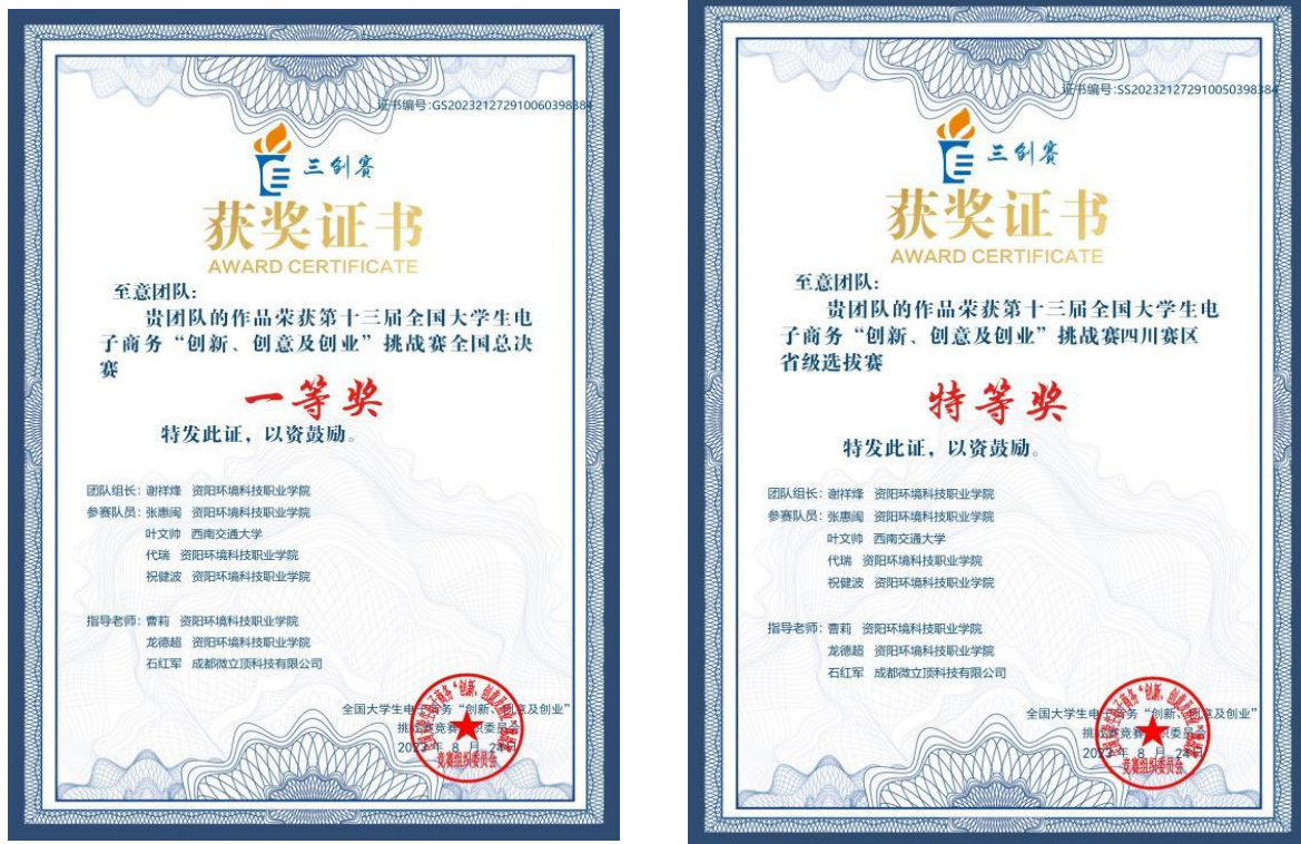
图 17 荣获“三创大赛”四川赛区特等奖和全国总决赛一等奖