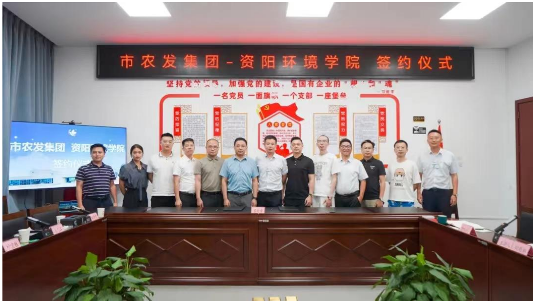
图 30 学院与资阳市农发集团签订校企合作协议