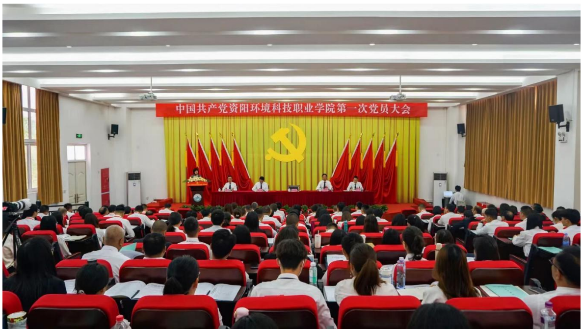
图 2 中国共产党资阳环境科技职业学院委员会 第一次党员大会胜利召开

二是着力打造党建品牌。认真学习推广省级“党建工作品牌”和“优秀支部工作法”，着力推进学院“一院（系）一党建品牌、一支部一党建特色”。三是推动基层党建工作提质增效。开展了党务工作突出问题清查整治工作。严格“三会一课”制度，基层党组织生活质效明显提升。