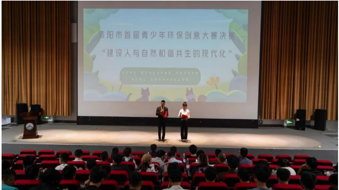
图 28 资阳市首届青少年环保创意大赛开幕

现。未来环境工程系将继续做好生态文明理念建设者和传播者，为中国式现代化贡献青春力量！