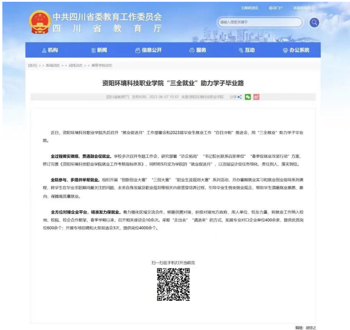
图 13 四川省教育厅网站专题报道《“三全就业”助力学子毕业路》