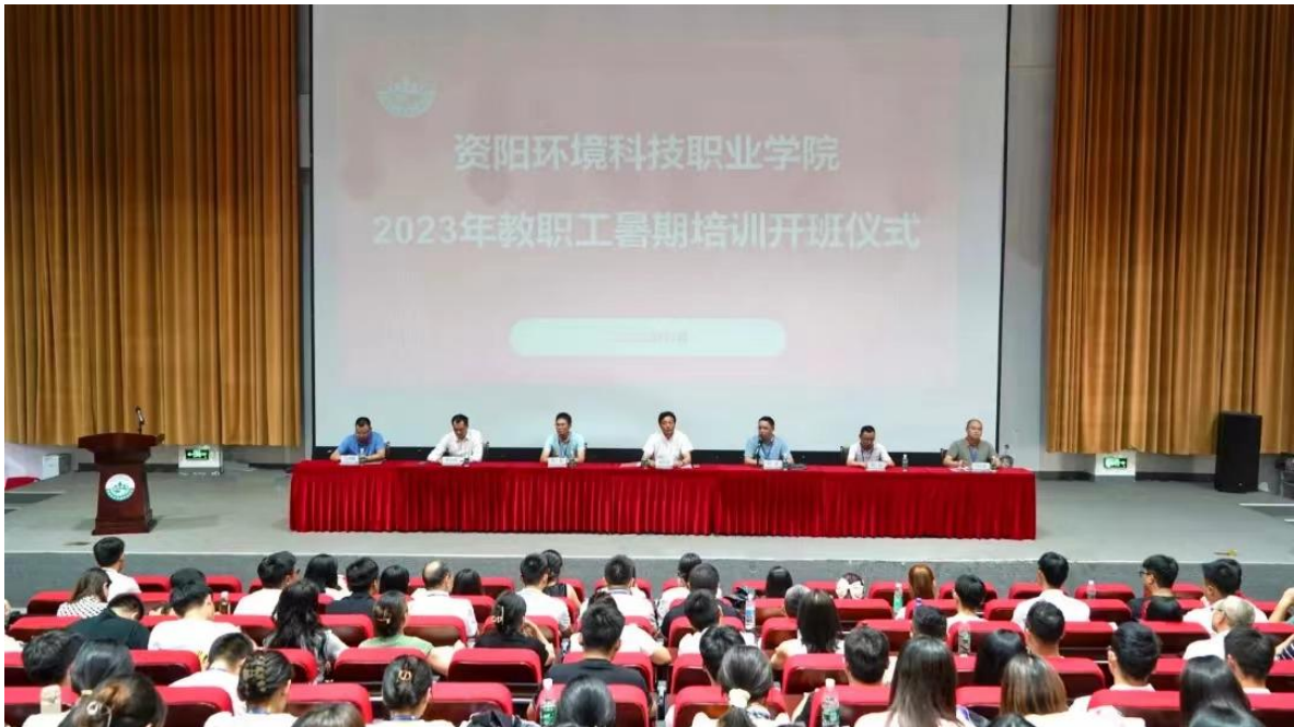
图 22 2023 年教职工暑期培训开班

为提升教师素质与能力，学院多次组织教师参加 2023 年教职工培训、四川省职业院校教师培训项目、新入职教师职业技能（岗前）培训等各类培训进修项目 13 余项，本学年累计培训教师 410 人次，教师累计参培时间 13940 小时；学院管理干部参加各级各类培训 39 人次。学院教师获得市级以上奖项 27 人次。